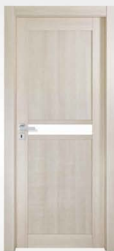
mod. TZ / TZ-P tortora chiaro light dove gray tourterelle clair

vetro incluso glass included verre inclu