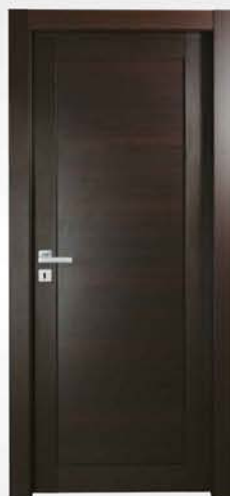
mod. T1 wengè dark dove gray wengé

descrizione porta: anta telaio con pannello liscio