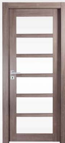
mod. T1-6V tortora scuro dark dove gray tourterelle foncé

vetro escluso glass not included verre exclu