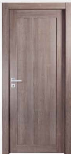
mod. T1 tortora scuro dark dove gray tourterelle foncé

descrizione porta: anta telaio con pannello liscio