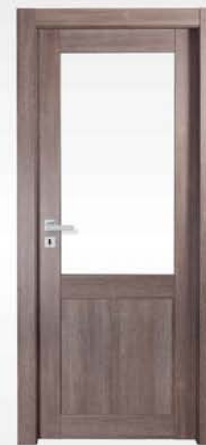
mod. T2-V tortora scuro dark dove gray tourterelle foncé

vetro escluso glass not included verre exclu