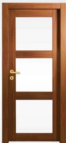
mod. T3-V noce nazionale national walnut noyer national

vetro escluso glass not included verre exclu