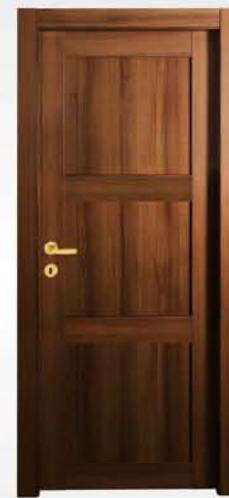
mod. T3 noce nazionale national walnut noyer national

descrizione porta: anta telaio con due fasce centrali e tre pannelli lisci