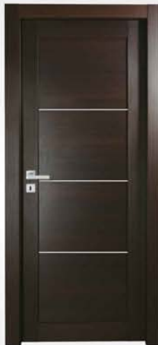
mod. T1-3I wengè wengè wengè

descrizione porta: anta telaio con pannello liscio e due inserti finitura cromo satinato