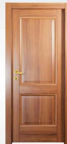
mod. T2B noce nazionale national walnut noyer national

descrizione porta: anta telaio con due fasce, due pannelli con bugne e fermabugne