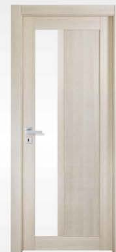
mod. T1-VL tortora chiaro light dove gray tourterelle clair

descrizione porta: anta telaio con pannello liscio predisposta per vetro laterale