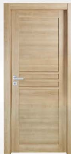
mod. TZ2 noce crudo raw walnut noyer brut

descrizione porta: anta telaio con tre fasce centrali piccole, un pannello liscio