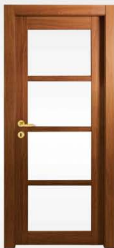
mod. T1-4V noce nazionale national walnut noyer national

vetro escluso glass not included verre exclu