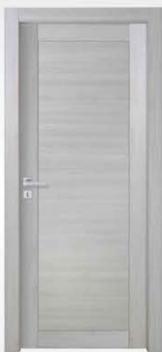
mod. T1 rovere grigio gray oak chêne gris

descrizione porta: anta telaio con pannello liscio