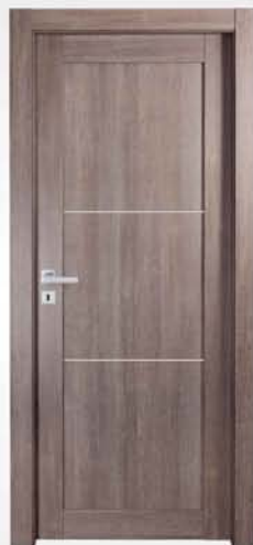
mod. T1-2I tortora scuro dark dove gray tourterelle foncé

descrizione porta: anta telaio con pannello liscio e due inserti finitura cromo satinato