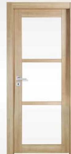
mod. T1-3V noce crudo raw walnut noyer brut

vetro escluso glass not included verre exclu