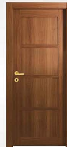
mod. T1-4P ciliegio cherry merisier

descrizione porta: anta telaio con quattro pannelli lisci e tre da 35mm