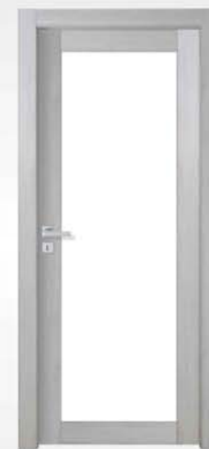
mod. T1-V rovere grigio gray oak chêne gris

descrizione porta: anta telaio con pannello liscio predisposta per vetro