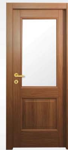
mod. T2B-V ciliegio cherry merisier

vetro escluso glass not included verre exclu