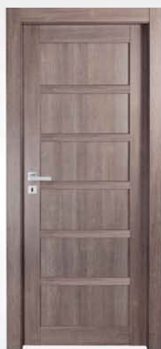
mod. T1-6P tortora scuro dark dove gray tourterelle foncé

descrizione porta: anta telaio con sei pannelli lisci e cinque fasce da 35mm