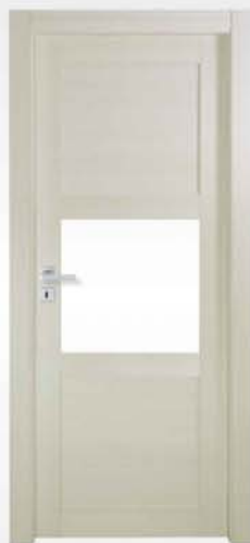
mod. T3-1V palissandro white rosewood white palissandre blanc

vetro escluso glass not included verre exclu