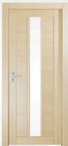
mod. T1-VC rovere sbiancato whitened oak chêne blanchi

vetro escluso glass not included verre exclu