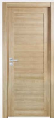
mod. T2 noce crudo raw walnut noyer brut

descrizione porta: anta telaio con fascia centrale e due pannelli lisci