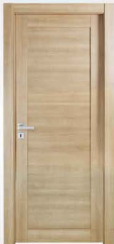
mod. T1 noce crudo raw walnut noyer brut

descrizione porta: anta telaio con pannello liscio